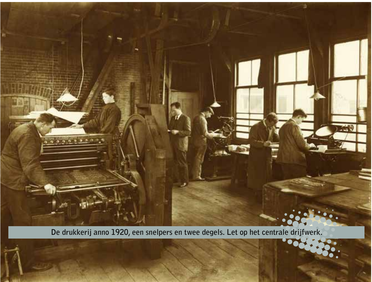
De drukkerij anno 1920, een snelpers en twee degels. Let op het centrale drijfwerk.