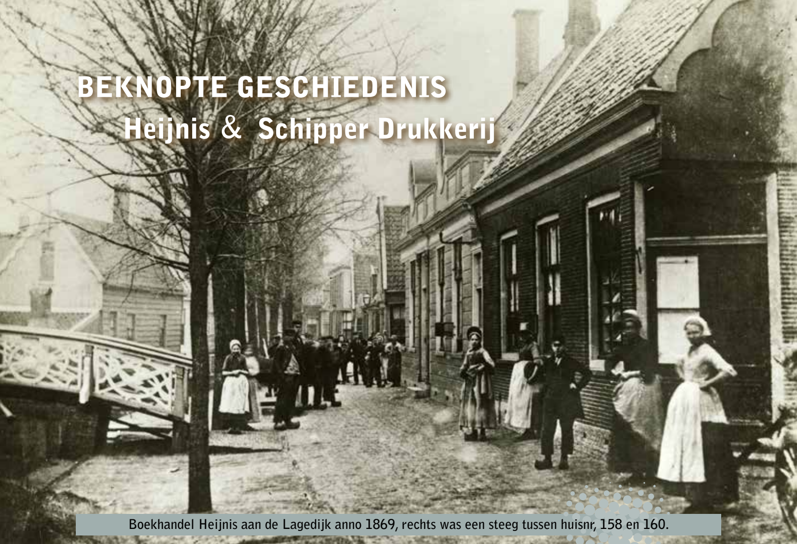
Boekhandel Heijnis aan de Lagedijk anno 1869, rechts was een steeg tussen huisnr, 158 en 160.