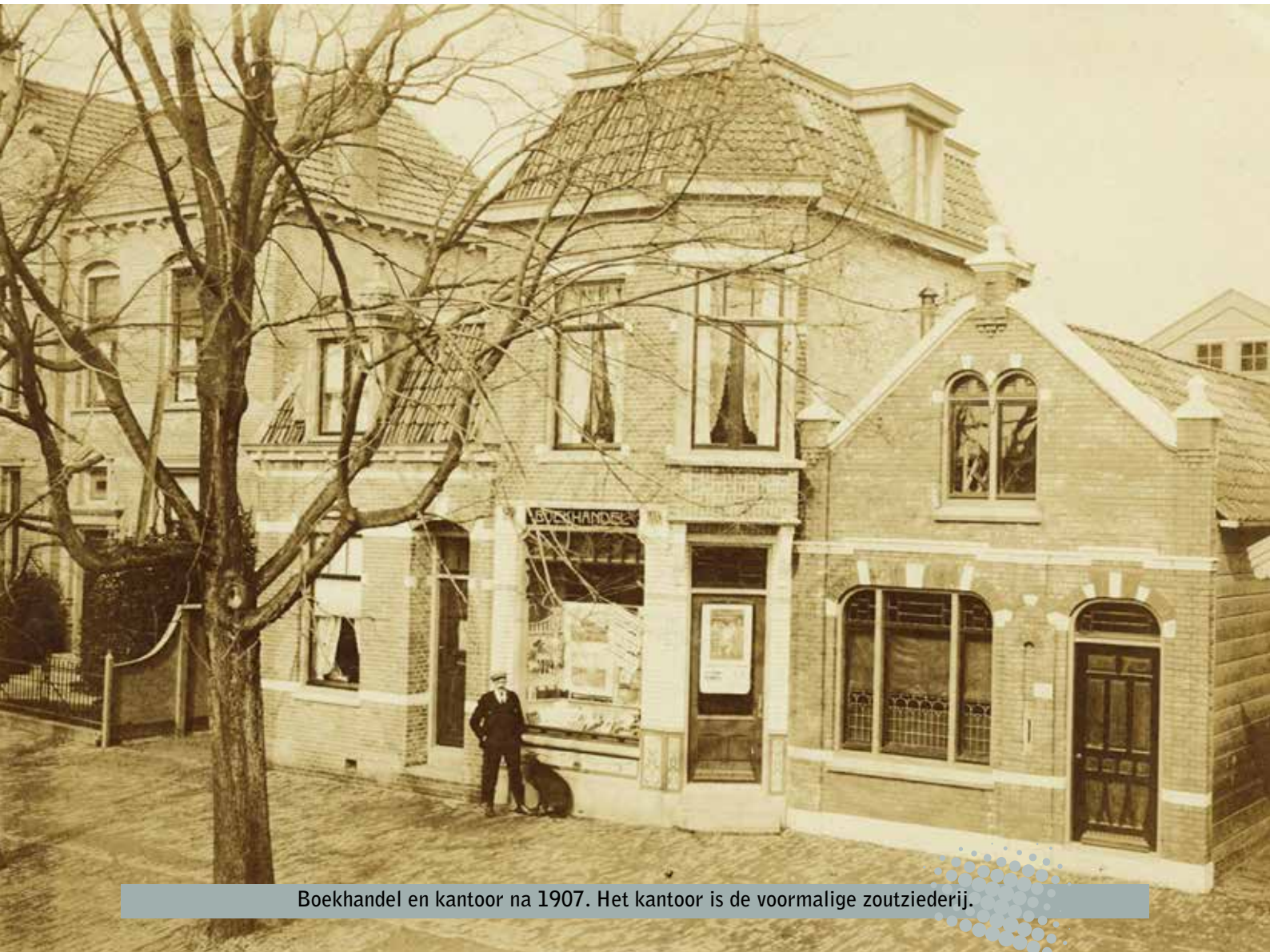
Boekhandel en kantoor na 1907. Het kantoor is de voormalige zoutziederij.