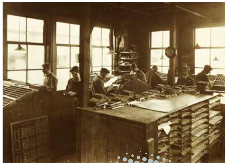
De zetterij anno 1920. Alles werd destijds met de hand in lood gezet!